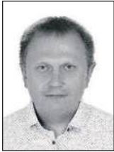
Олександр КРАВЧУК , заступник начальника відділу Міністерства внутрішніх справ України

С ьогодні як для України, так і міжнародної спільноти надзвичайно важливим є формування стратегії, тактики і мистецтва креативної освіти, науки і практики для забезпечення екологічної безпеки та збереження фундаментальних основ екологічної системи й природного навколишнього середовища.