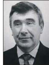
Петро БІЛЕНЧУК , професор Європейської академії прав людини