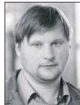
Юрій ПАНЧЕНКО, ЄП

Перший президент Польщі, який вступає на посаду з відкритою кримінальною справою. Саме таке «досягнення» встановив переможець цьогорічних президентських виборів Кароль Навроцький.