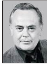
Олександр КОСТЕНКО, доктор юридичних наук, професор, академік НАПрН України

Для того, аби адекватно відповідати на виклики часу, юридична наука має заглиблюватися у фундаментальні проблеми. Від їх вирішення залежить ефективність практичної діяльності по забезпеченню правопорядку в суспільстві.