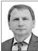
Олег ТКАЧУК, суддя Великої Палати Верховного Суду

На одинадцятому році війни все частіше звучить питання про необхідність відновлення в Україні військових судів. Днями про це написав генерал армії Віктор Муженко, який у 2014–2019 рр. був начальником Генштабу – Головнокомандувачем ЗСУ. Більше того, окрім теми військових судів, генерал порушує й тему військової адвокатури та нагадує всім, що на цьому він наголошував ще в 2017 році.